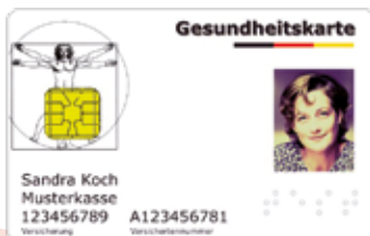
Muster einer Gesundheitskarte (Vorderseite)

Der Arzt rechnet dann direkt mit der Krankenversicherung ab.