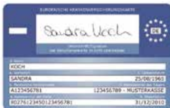
Muster einer Gesundheitskarte (Rückseite)

The doctor will send his/her bill to your health insurance.