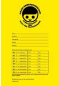
Health checkup planner for babies

For each newborn child, women receive a planner with a schedule of all health checkups for their baby. In this planner all health checkups for children and young people up to their 14th year are recorded. Here is a checklist: